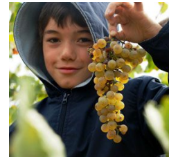
Bio-Weingut aber nicht Zertifiziert