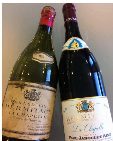
1915er und 2015er la Chapelle